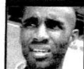
Frederic Kanouté DELANTERO DEL SEVILLA

«Cultura sólo estará atenta a la conservación de la Fábrica de Artillería»