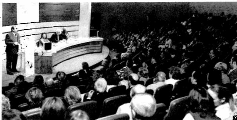
Aspecto del salón de actos de la CEA, completamente lleno, durante el acto